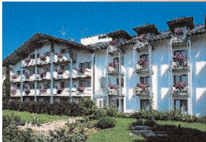
Zimmer mit Blick auf den herrlichen Garten in sehr ruhiger Lage